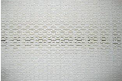
ULPA 15 filtre kartuşunun filtre ayrıntıları