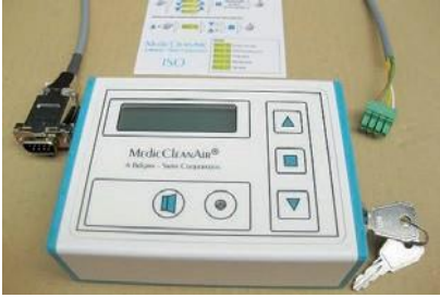
Kalıcı basınç farkı ekranı ile anahtarlı Uzaktan Kumanda, bağlantı fişleri olan kablo, hastane personeli için kısa talimat kılavuzu (baş hemşireler, teknik bölüm, vs.)