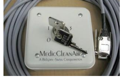
Anahtar konumları 0 - 1 - 2 - 3 - 4 ile çalıştırılan Standart Uzaktan Kumanda