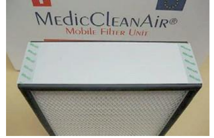
Filtre kartuşu ULPA 15