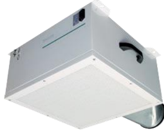
Duvara veya tavana montaj için standart ISO 520 Cihazı - filtre ünitesi, kablo bağlantıları ve özel boru bağlantısı ile ana görünüm