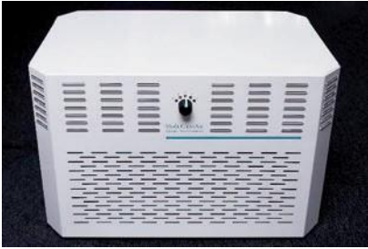
Appareil standard Pro 110 avec revêtement époxy blanc antibactérien