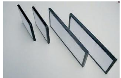
Préfiltre supplémentaire à l'extérieur de l'appareil