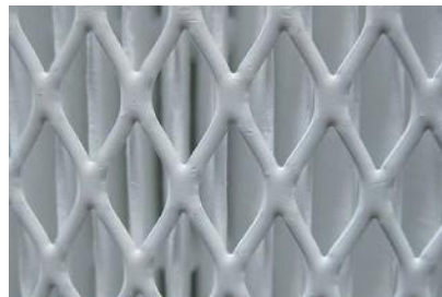
Détail de la cartouche filtrante ULPA 15 - protection du filtre par une grille