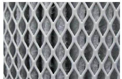
Détail de la cartouche filtrante MedicCleanAir Pro H14 avec grille pour protéger le filtre. Photo prise à l'avant du F9 + charbon actif (= d'où la couleur noire)