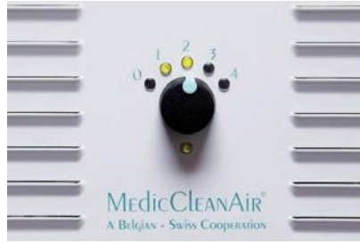
Détail des niveaux de purification standard 0 - 1 - 2 - 3 - 4, voyants et vérification du filtre (vert-jaune-rouge)