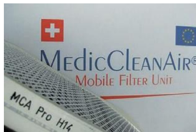
La cartouche filtrante MedicCleanAir Pro H14 est composée du préfiltre F9 + charbon actif + niveau Hepa14