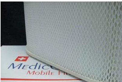
Cartouche filtrante Ulpa 15