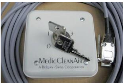
Télécommande à clé (fonctionnement réservé au personnel hospitalier)