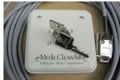
Стандартный пульт дист. управления с ключом, положения 0 - 1 - 2 - 3 - 4