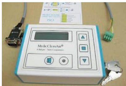
Пульт дист. управления с ключом и функцией постоянного мониторинга разницы давлений, кабелем со штепселями, краткое рук-во по эксплуатации для персонала клиник (старшие медсестры, техотдел и т.д.)