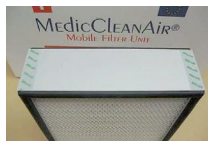
Фильтрующий блок ULPA 15