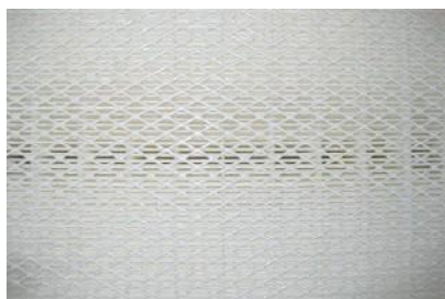
Вид фильтрующего блока ULPA 15