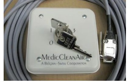
Anahtar konumları 0 - 1 - 2 - 3 - 4 ile çalıştırılan Standart Uzaktan Kumanda