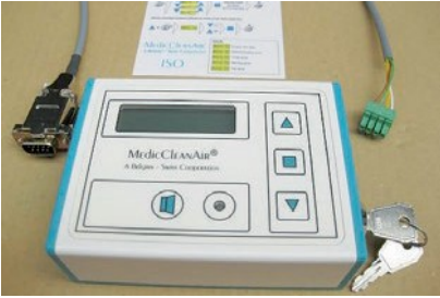
Kalıcı basınç farkı ekranı ile anahtarlı Uzaktan Kumanda, bağlantı fişleri olan kablo, hastane personeli için kısa talimat kılavuzu (baş hemşireler, teknik bölüm, vs.)