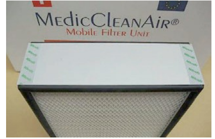
Filtre kartuşu ULPA 15