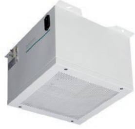
Duvara veya tavana montaj için standart ISO 100 Cihazı - filtre ünitesi ve kablo bağlantıları ile ana görünüm