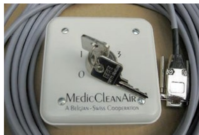
Mando a distancia estándar operado por llave con posiciones 0 - 1 - 2 - 3 - 4