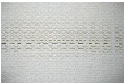
Detalhe do filtro do cartucho de filtragem ULPA 15