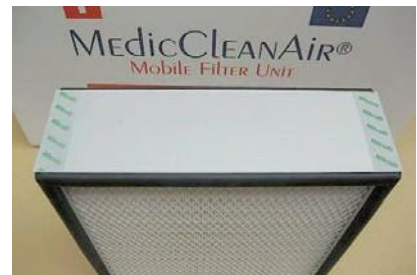
Cartucho de filtragem ULPA 15