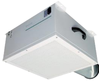
Aparelho Standard ISO 520 para montagem na parede ou teto - vista principal com unidade de filtragem, conexões por cabo e ligação especial para tubo