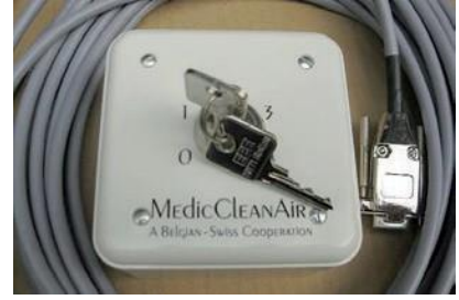
Controle remoto padrão operado com chave, com níveis: 0 - 1 - 2 - 3 - 4