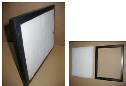
Pré-filtragem adicional instalada na parte exterior da unidade