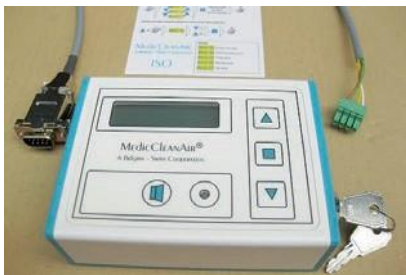
Controle remoto com chave e tela de pressão diferencial, cabo com tomadas de ligação, manual de instruções sucinto para funcionários do hospital (enfermeiros chefe, departamento técnico, etc.)