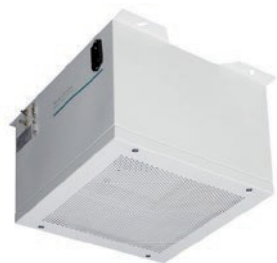
Aparelho Standard ISO 100 para montagem na parede ou teto - vista principal com unidade de filtragem e conexões por cabo