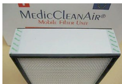
Cartucho de filtragem ULPA 15