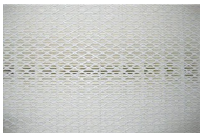
Detalhe do filtro do cartucho de filtragem ULPA 15