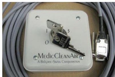
Controle remoto padrão operado com chave, com níveis: 0 - 1 - 2 - 3 - 4