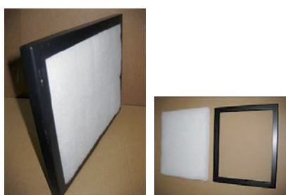
Pré-filtragem adicional instalada na parte exterior da unidade