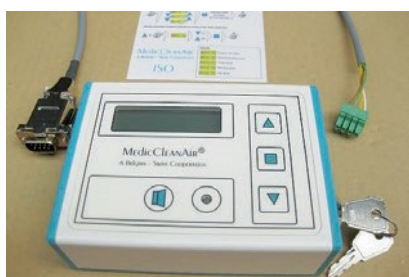
Controle remoto com chave e tela de pressão diferencial, cabo com tomadas de ligação, manual de instruções sucinto para funcionários do hospital (enfermeiros-chefe, departamento técnico, etc.)