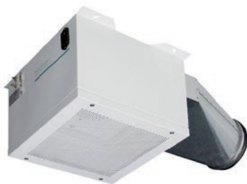
Aparelho Standard ISO 120 para montagem na parede ou teto - vista principal com unidade de filtragem, conexões por cabo e ligação especial para tubo